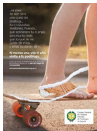
Los tres anuncios de la campaña