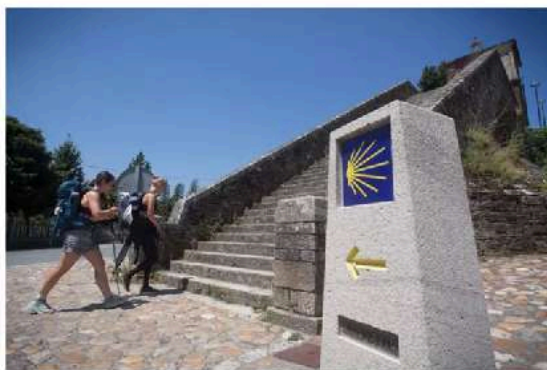
Dos personas realizan el Camino de Santiago, a 15 de junio de 2021, en Portomarin, Lago, Galicia, (España). MADRID, 21 Jun. (EUROPA PRESS)