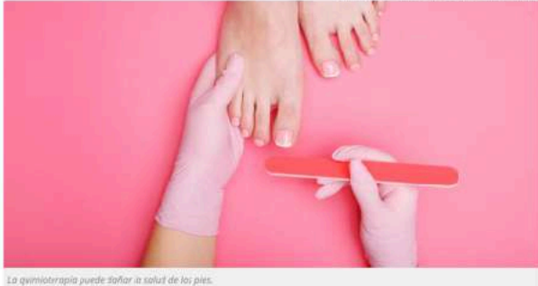
La quimioterapia puede dañar la salud de los pies.

Actualizado a: Martes, 19 Octubre, 2021 11:42:58